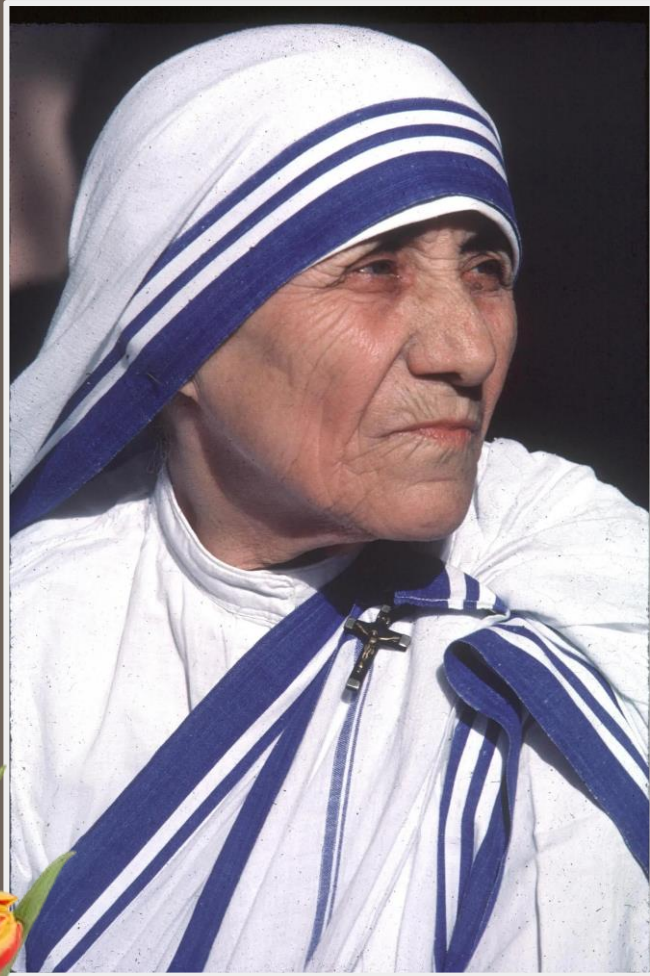
Тереза Калькуттская (1910-1997)

Тереза Калькуттская, известная во всем мире как Мать Тереза, урождённая Агнес Гондже Бояджиу, стала одной из самых выдающихся женщин современности. Об её святости и благих деяниях ходят легенды. Именно она создала легендарный орден «сестёр милосердия, или сестёр миссионерской любви», которые служили больным и бедным.