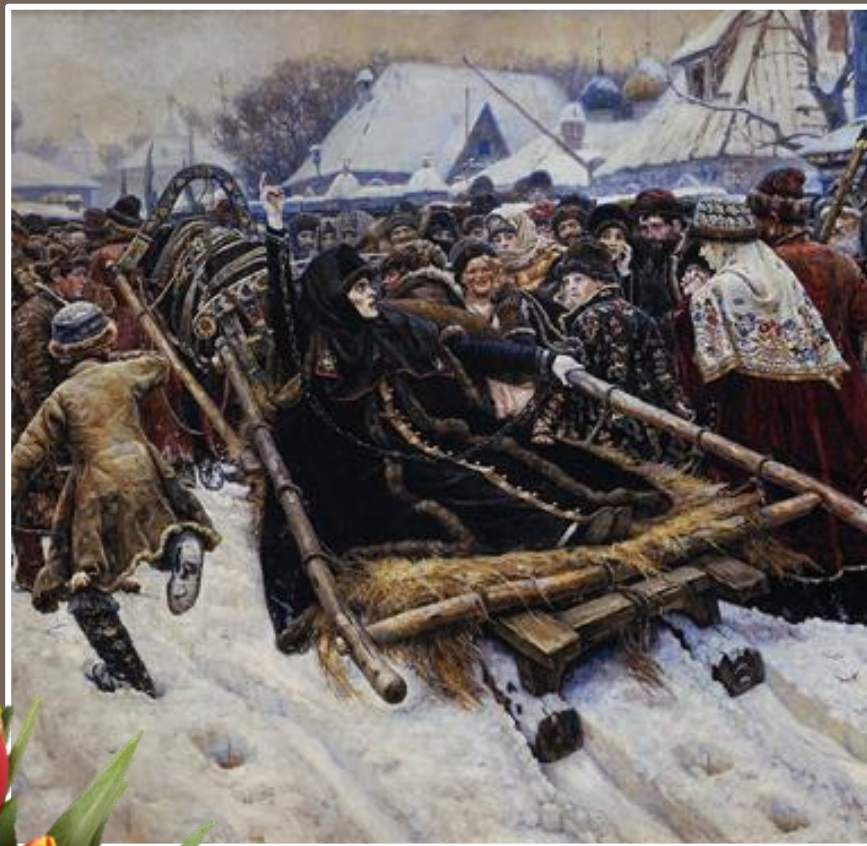
В. И. Суриков «Боярыня Морозова»

Боярыня Феодосия Прокопьевна Морозова (1632-1675) – деятельница русского старообрядчества, сподвижница протопопа Аввакума. За приверженность к «старой вере» в результате конфликта с царём Алексеем Михайловичем была арестована, лишена имения, а затем сослана в Пафнутьево-Боровский монастырь и заточена в монастырскую тюрьму, в которой погибла от голода.