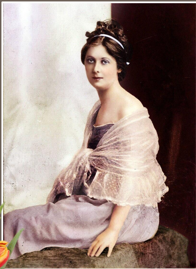
Айседора Дункан (1877-1927)

Айседора Дункан – американская танцовщица, основоположница танцевальной системы и пластики на основе древнегреческого танца.