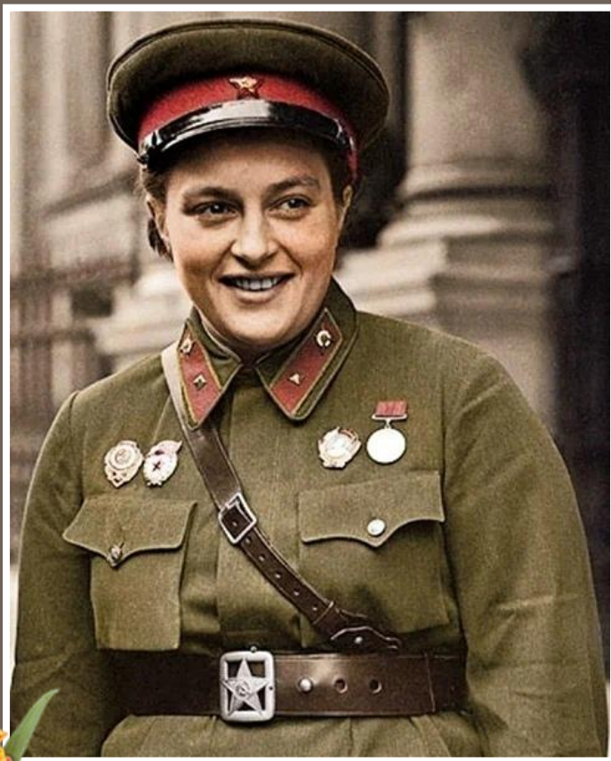
Людмила Михайловна Павличенко (1916—1974)

Людмила Михайловна Павличенко — легендарная женщина-снайпер, Герой Советского Союза. В ходе осады Крыма весной 1942 года Павличенко служила в Севастополе в гарнизоне Крымского фронта и убила более 300 солдат противника.