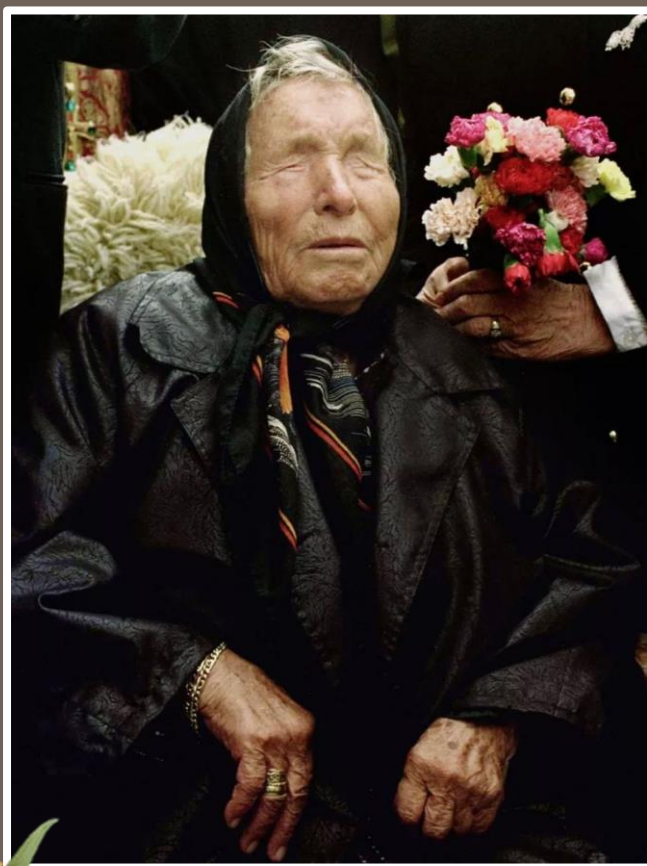
Вангелия Пандева Димитрова (1911-1996)

Ванга - болгарская прорицательница. Её удивительный дар, до сих пор не получивший научного объяснения, помог сотням тысяч людей обрести надежду.