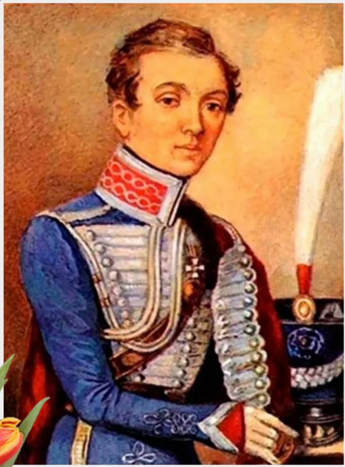
Надежда Дурова (1783-1866)