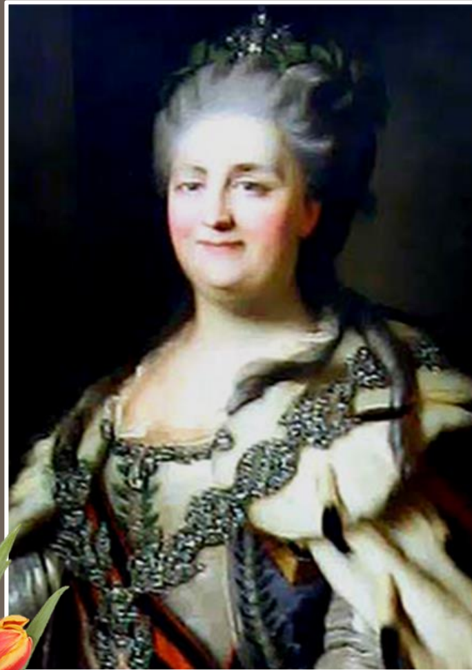
Екатерина II Великая (1729-1796)

Императрица Екатерина II правила с 1762 по 1796 год и это время называют «золотым веком» России. Ей были проведены важные преобразования в военной, социальной и финансовых сферах, а также серьезные реформы в области просвещения.