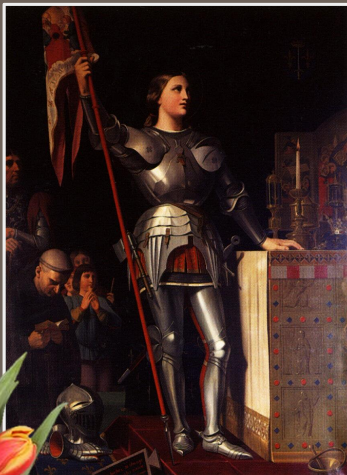
Жанна д'Арк (1412-1431)

Жанна д'Арк – орлеанская дева, национальная героиня Франции. Возглавила борьбу французского народа против английских захватчиков, в 1429 году освободила Орлеан от осады. Её деятельность повлияла на результаты Столетней войны (1337–1453).