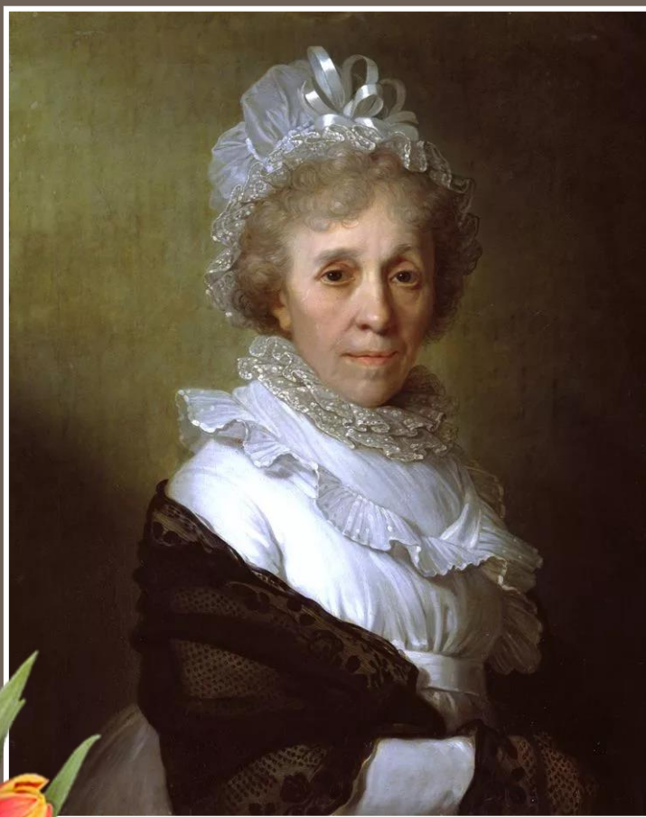
«Портрет Н.П. Голицыной» В. Боровиковский

Наталия Петровна Голицына (1744-1838) – княгиня, её называли фрейлиной четырех императоров, ибо она была близка к императорской семье, а годы ее жизни оказались куда продолжительнее, чем периоды правления глав Российской империи того времени.