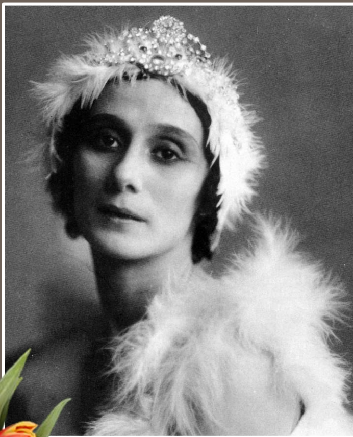
Анна Матвеевна Павлова (1881-1931)

Анна Павлова – русская артистка балета, прима-балерина Мариинского театра в 1906–1913 годах, одна из величайших балерин XX века.