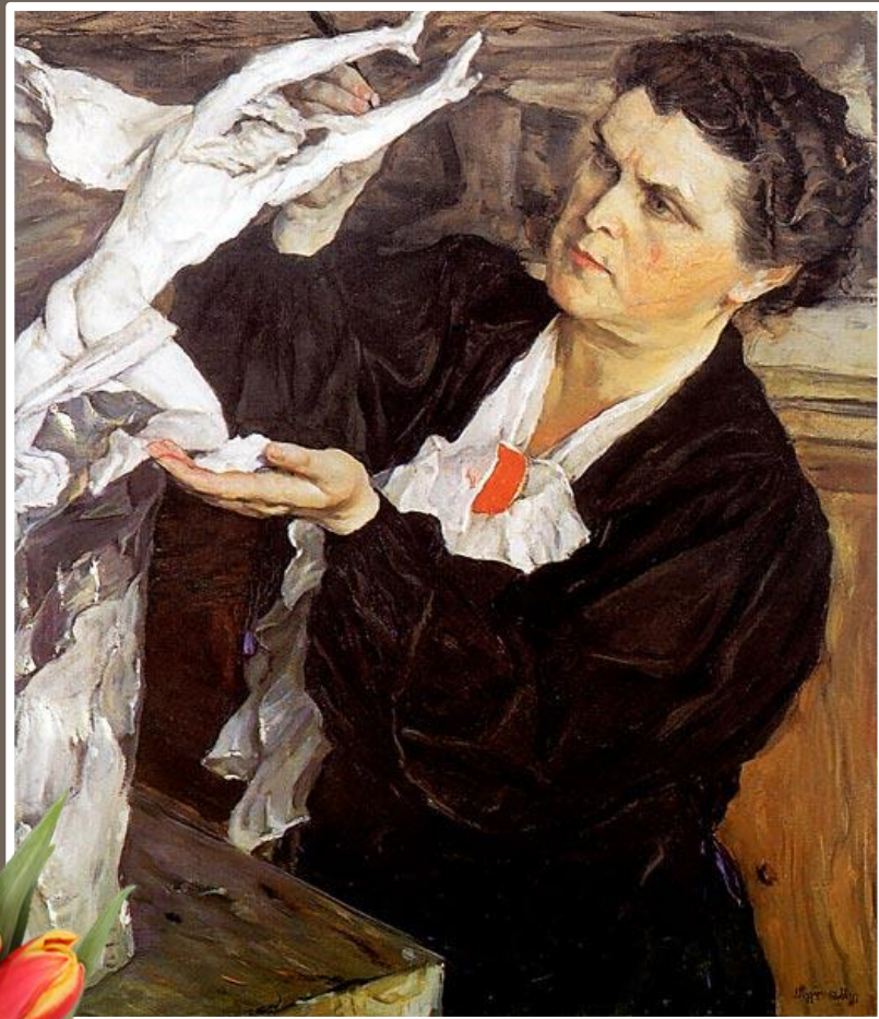
Вера Игнатьевна Мухина (1889-1953)

Вера Игнатьевна Мухина - советский, российский скульптор-монументалист, педагог. Она прославилась благодаря скульптурной группе «Рабочий и колхозница».