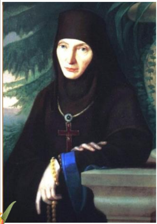
Маргарита Михайловна Тучкова (1780–1852)

Маргарита Михайловна Тучкова, впоследствии инокиня Мелания – основательница Спасо-Бородинского монастыря.