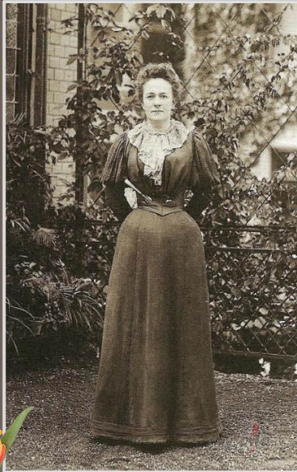
Клара Цеткин (1857-1933)

В современном мире день женщин отмечается 8 Марта. История этого праздника началась в XIX веке, и был он приурочен ко дню борьбы за права женщин.