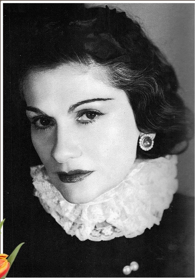
Коко Шанель (1883-1971)

Габриэль Бонёр (Коко) Шанель – французская модельер и основательница модного дома Chanel, оказавшая существенное влияние на европейскую моду XX века.