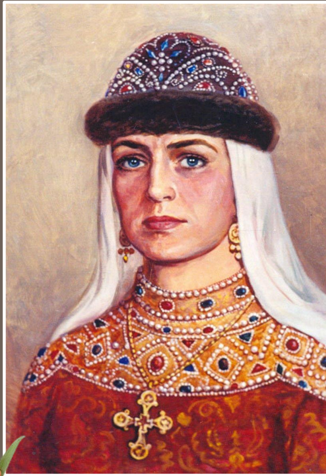
Великая княгиня Киевская Ольга (около 893/920— 969)

Княгиня Ольга является первой женщиной – правительницей Руси, она была регентом при малолетнем сыне Святославе, после убийства её мужа Игоря Рюриковича древлянами и правила Великой Русью с 945 года по 960 год. За время своего правления она не вела боевых действий, все вопросы по внешней политике старалась решать переговорами.