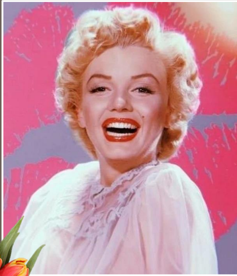
Мэрилин Монро (1926-1962)

Мэрилин Монро ( настоящее имя Норма Джин Мортенсон) – замечательная американская актриса, певица, модель, покоровшая весь мир своей необыкновенной прелестью и сияющей красотой. Поднявшись на вершину карьеры с самых низов, она стала одним из наиболее культовых образов американского кинематографа и всей мировой культуры.