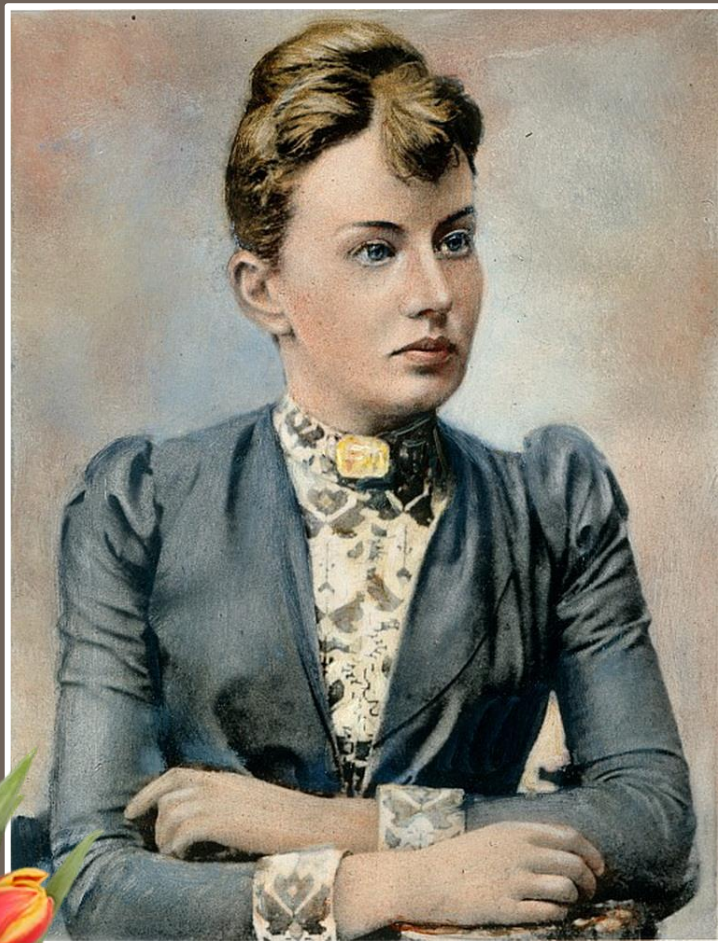
Софья Ковалевская (1850 – 1891)

Софья Васильевна Ковалевская – первая в мире женщина, удостоенная звания профессора математики, член-корреспондент Петербургской академии наук.