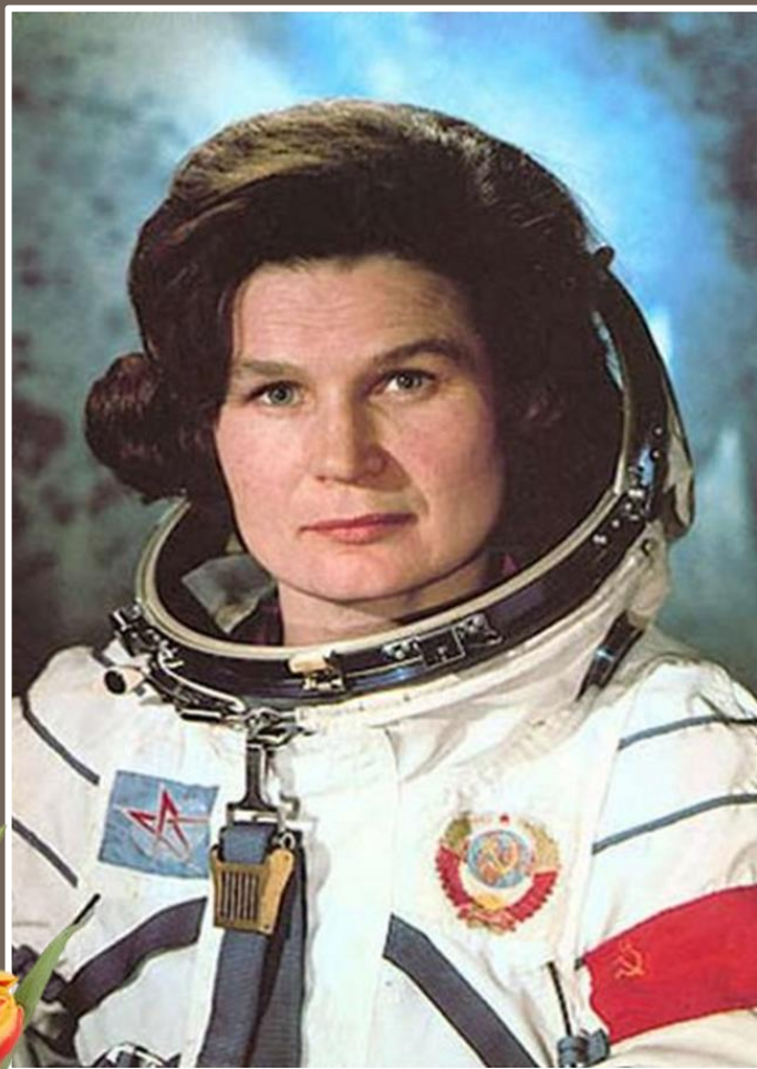
Валентина Терешкова (1937 г.р.)

«Эй! Небо, сними шляпу!» – эти слова произнесла перед стартом первая в мире женщина – космонавт Валентина Владимировна Терешкова. 16–19 июля 1963 года она на корабле «Восток-6» совершила полет в космос, который продолжался 72 часа, и совершила 48 оборотов вокруг Земли. Её позывной был «Чайка».