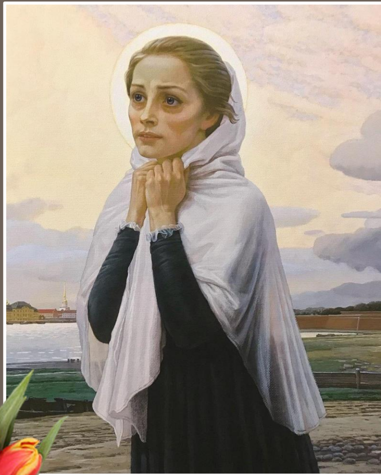
Ксения Петербургская (около 1731 — около 1802 года)

Ксения Петербургская (настоящее имя Ксения Григорьевна Петрова) православная юродивая дворянского происхождения, жившая в Санкт-Петербурге.