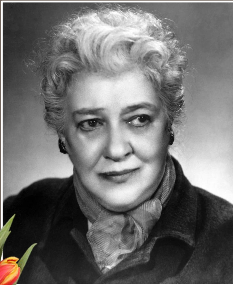
Фаина Георгиевна Раневская (1896-1984)

Фаина Раневская (имя при рождении – Фанни Гиршевна Фельдман) – одна из величайших русских актрис XX века. В сознании российского общества Раневскую, наверное, чаще всего связывают со множеством ее изречений, большинство из которых стали крылатыми.