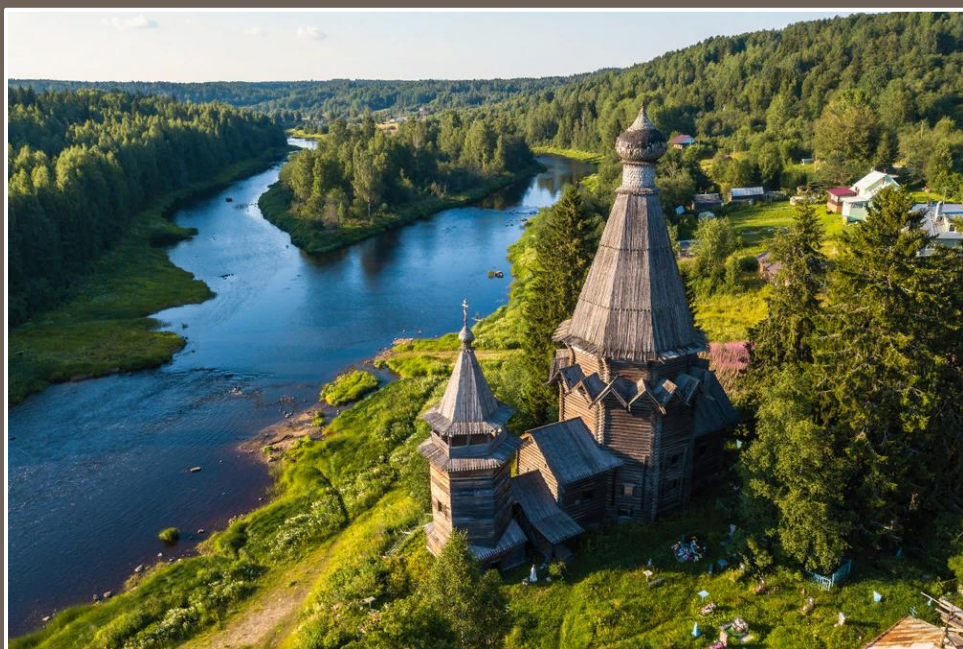
Церковь Николая Чудотворца (построена в 1696 году) в деревне Согиницы на реке Важинке. Республика Карелия

А вот Карелия, расположенная на границе с Финляндией, является домом для другого народа — карелов.