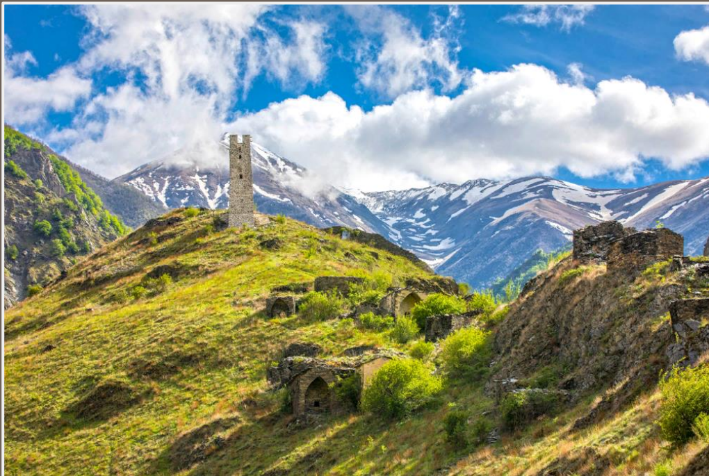
Сторожевая башня в Некрополе Цой-Педе в Чеченской Республике

Интересно, что чеченский язык уникален для Кавказского региона, так как не связан ни с какими языками за его пределами.