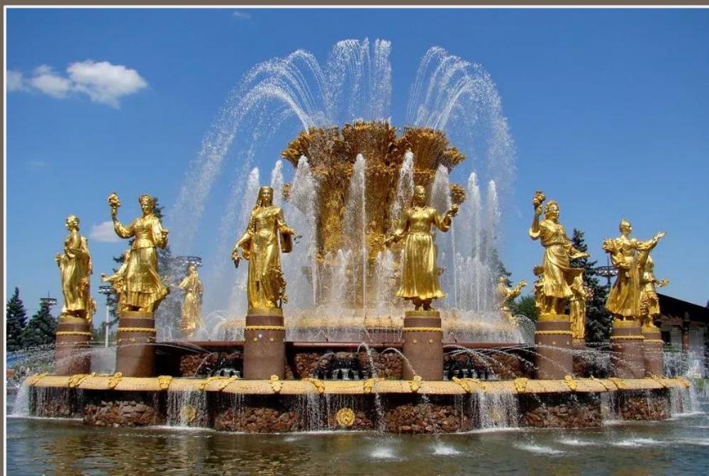
Фонтан «Дружба народов» на ВДНХ в Москве

Фонтан «Дружба народов» на ВДНХ в Москве символизирует советские республики. Он был построен в 1945 году.