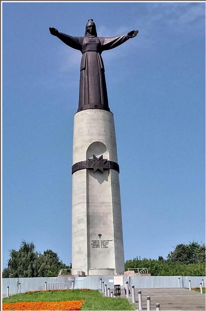
Монумент Матери-Покровительнице в столице Чувашии Чебоксарах

Монумент Матери (Монумент Матери-Покровительнице) — произведение монументального искусства, который расположен на древнем холме в исторической части города Чебоксары.