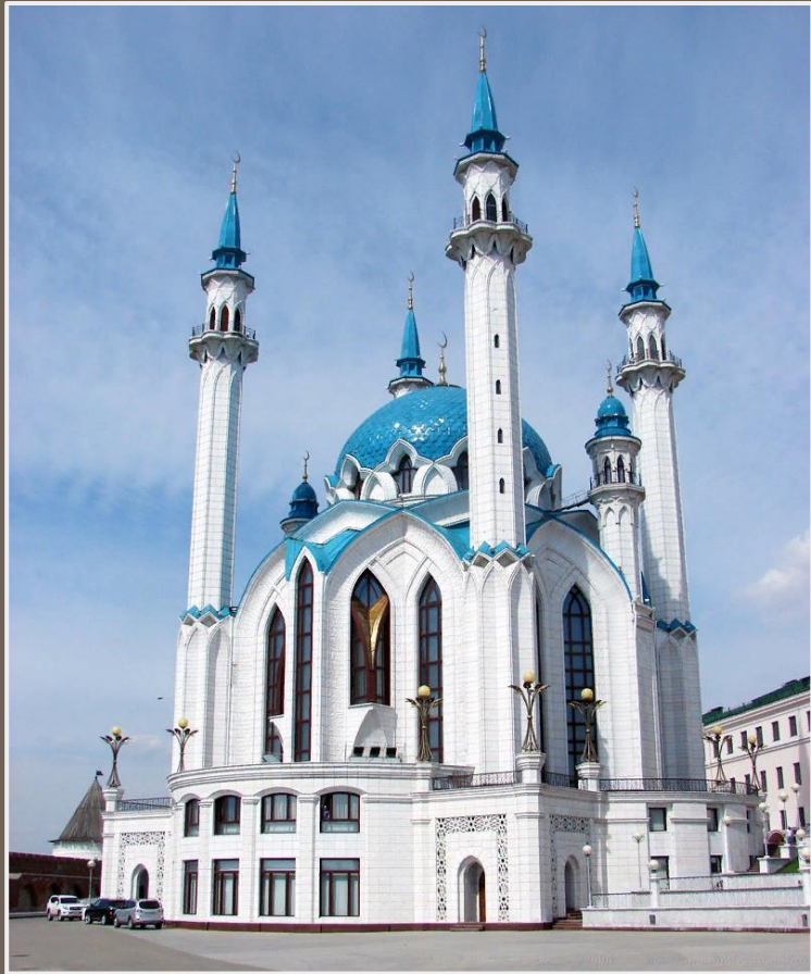
Мечеть «Кул-Шариф» (тат. «Кол Шәриф»), главная соборная джума-мечеть республики Татарстан и города Казани

Сегодня в Татарстане всё ещё много древних татарских реликвий, расположенных по всей республике.