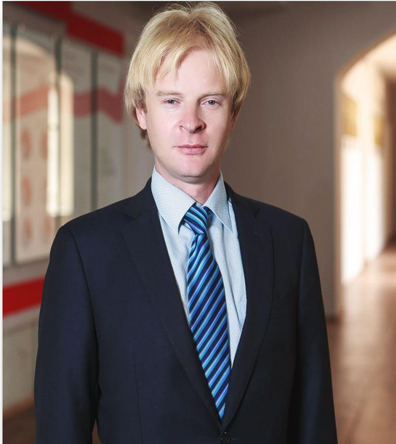
Ректор Александр Александрович Федоров

В 2011г. к старейшему вузу региона ГОУ ВПО «Нижегородский государственный педагогический университет» был присоединен самый молодой вуз области – ГОУ ВПО «Волжский государственный инженерно-педагогический университет».